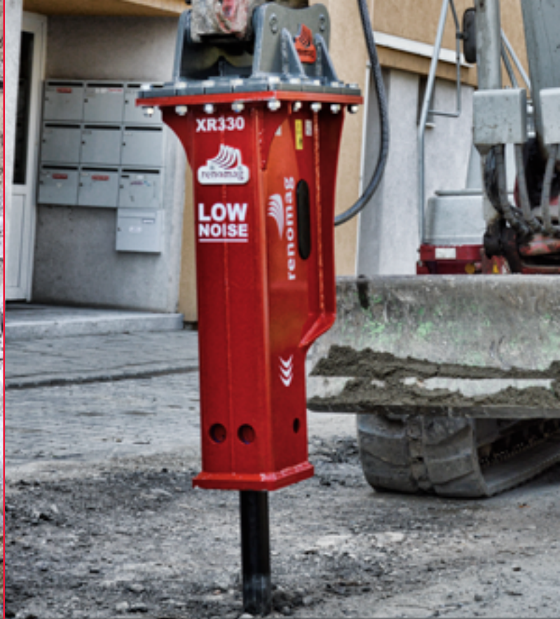
HYDRAULICKÉ KLADIVO RENOMAG XR330