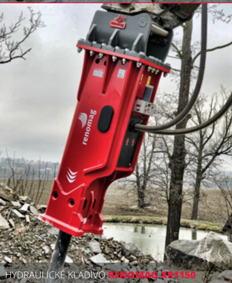
HYDRAULICKÉ KLADIVO RENOMAG XR1150