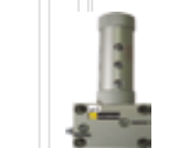
Vibráciami ovládaný systém s kovovou plniteľnou kartušou