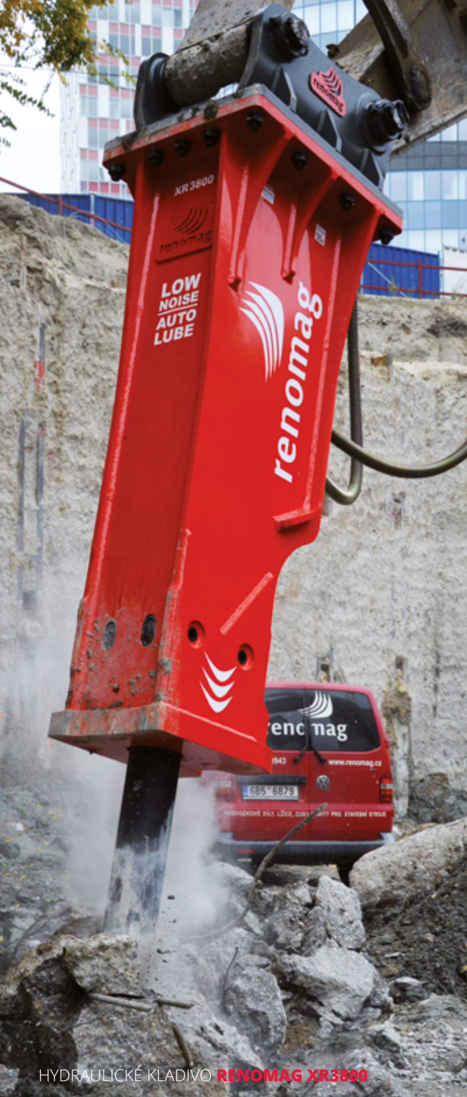
HYDRAULICKÉ KLADIVO RENOMAG XR3800