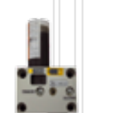
Vibráciami ovládaný systém s výmennou plniteľnou kartušou