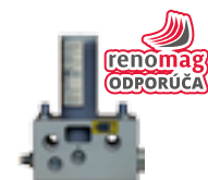
Hydraulicky ovládaný systém s výmennou plniteľnou kartušou