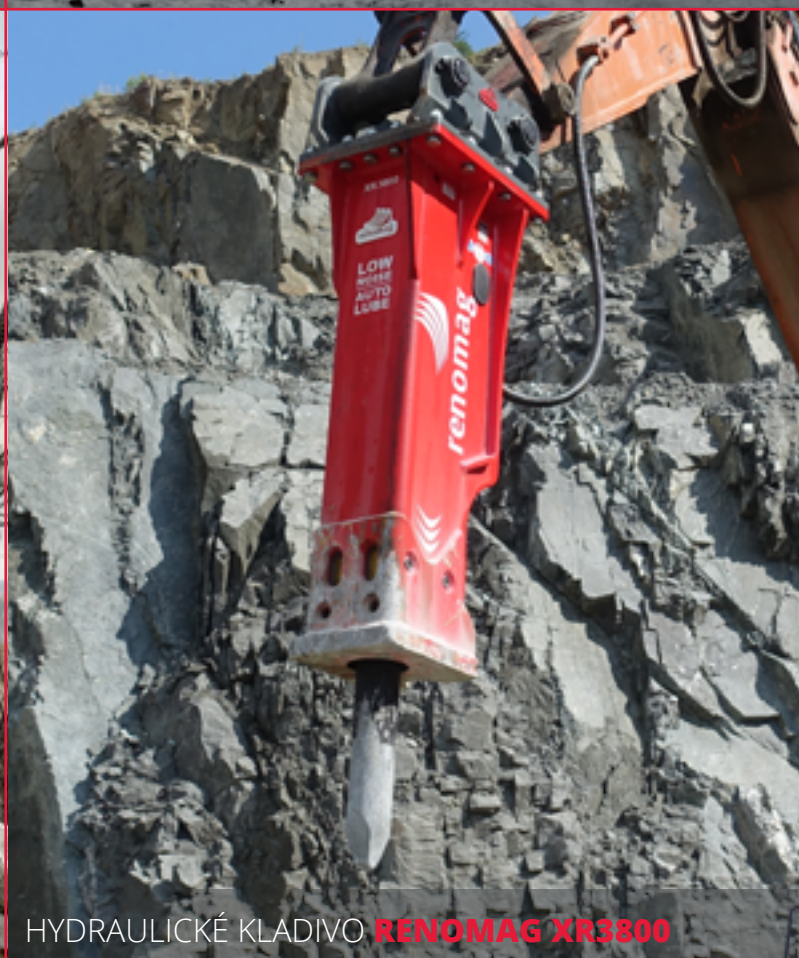
HYDRAULICKÉ KLADIVO RENOMAG XR3800