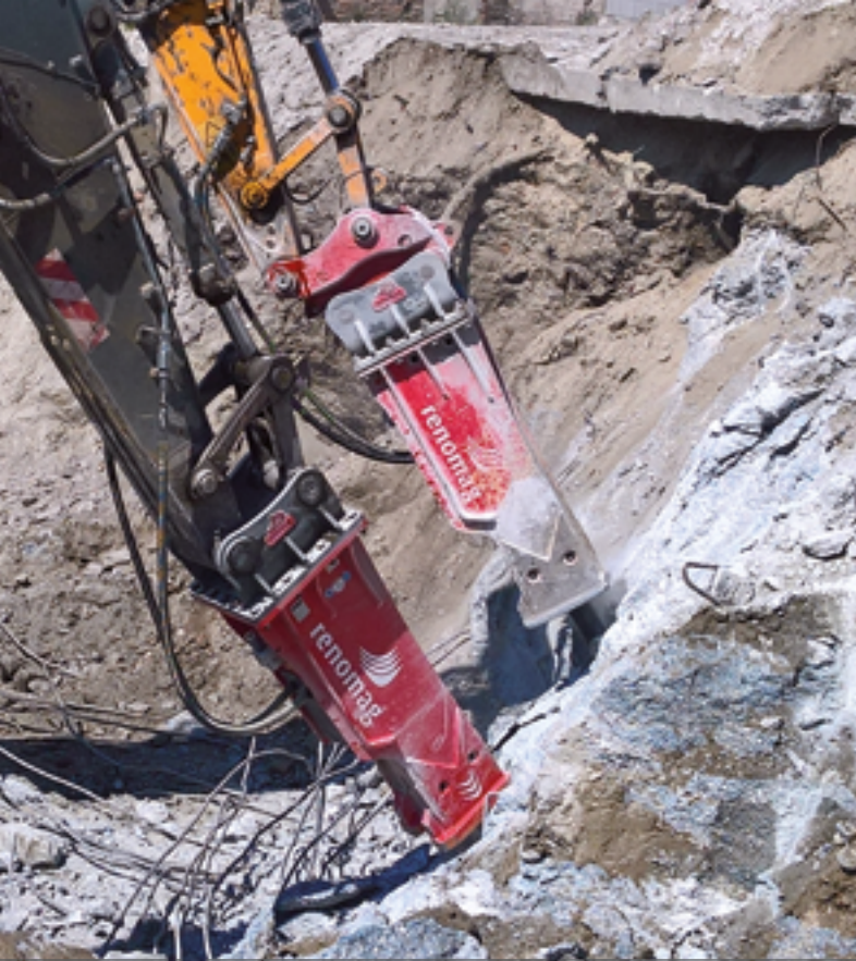
HYDRAULICKÉ KLADIVO RENOMAG XR3800