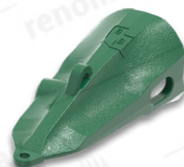
ZUBY SKALNÍ (DLÁTO)