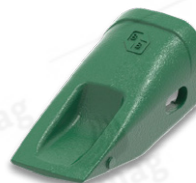
ZUBY PRO NAKLADAČE