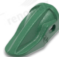
ZUBY PENETRAČNÍ PRO NAKLADAČE