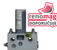
Hydraulicky ovládaný systém s výměnnou plnitelnou kartuší