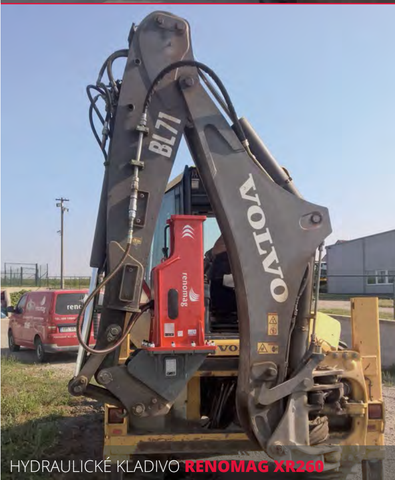
HYDRAULICKÉ KLADIVO RENOMAG XR260