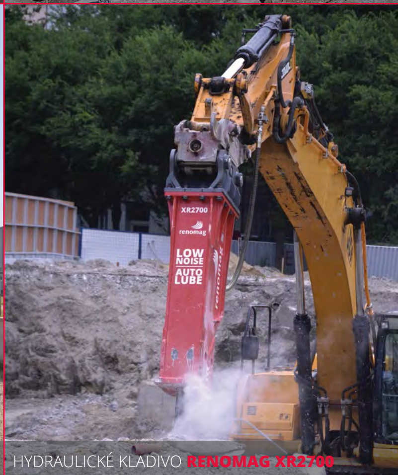
HYDRAULICKÉ KLADIVO RENOMAG XR2700