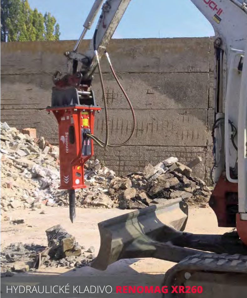
HYDRAULICKÉ KLADIVO RENOMAG XR260