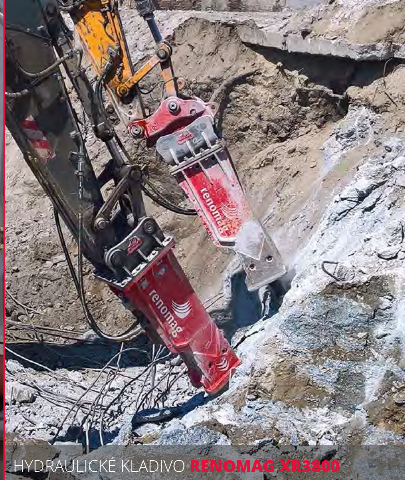
HYDRAULICKÉ KLADIVO RENOMAG XR3800